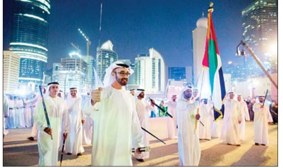
محمد بن زايد خلال زيارته لمهرجان قصر الحصن

بغداد-وكالات: دخل مفتي العراق على خط الأزمة الراهنة هناك، متهمًا ضمنا رئيس الوزراء نوري المالكي بالإعداد لحرب طائفية، وداعيا وزراء القائمة العراقية إلى الاستقالة على غرار وزير المالية الذي قدم استقالته أمام حشود من المتظاهرين في الرمادي. وطالب مفتي الديار العراقية رافع الرفاعي المالكي بالكف عن التلويح بالحرب الطائفية، ووصف هذا الحديث بأنه من ضرب الإبعاد لها، كما دعا وزراء القائمة العراقية إلى تقديم استقالاتهم من الحكومة كما فعل وزير المالية والقيادي بقائمة العراقية رافع العيسوي الذي أعلن استقالته أمام المتظاهرين في الرمادي. وقال الرفاعي إن اعتصام المتظاهرين دخل شهره الثالث دون استجابة من الحكومة لأي من مطالبهم، مشيرا إلى أن العراق تحول إلى واحد من أفسد الدول.