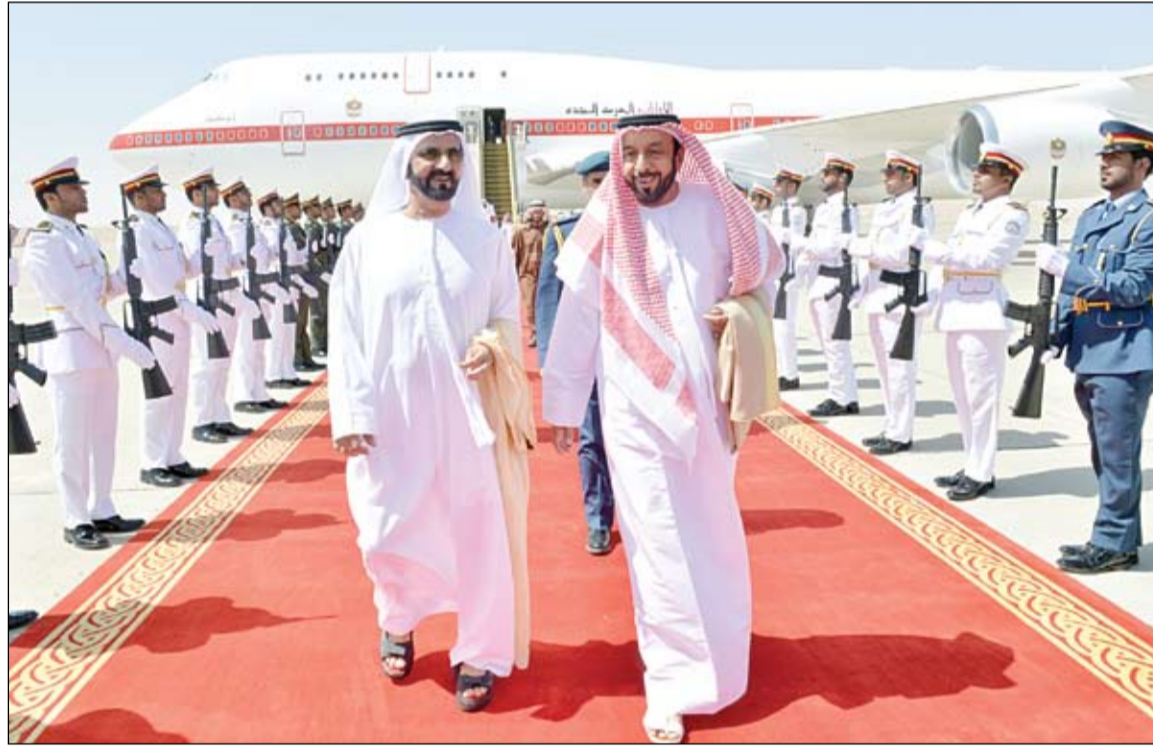
رئيس الدولة لدى وصوله الى أرض الوطن وفي استقباله محمد بن راشد

أبوظبي-وام: عاد صاحب السمو الشيخ خليفة بن زايد آل نهيان رئيس الدولة بسلامة الله وحفظه الى أرض الوطن ظهر امس بعد زيارة رسمية لتركمانستان تلبية لدعوة من فخامة الرئيس قربان قولي قيري محمديف رئيس تركمانستان اجرى خلالها مباحثات مع فخامته تتعلق بعلاقات التعاون والصداقة التي تربط البلدين لما فيه خير وصالح الشعبين الصديقين اضافة الى تبادل وجهات النظر حول عدد من القضايا ذات الاهتمام المشترك. واعقب سموه بعد ذلك زيارة خاصة لتركمانستان استغرقت عدة ايام. وكان في مقدمة مستقبلي صاحب السمو رئيس الدولة حفظه الله .. اخاه صاحب السمو الشيخ محمد بن راشد آل مكتوم نائب رئيس الدولة رئيس مجلس الوزراء حاكم دبي ..وسمو الشيخ سلطان بن زايد آل نهيان ممثل صاحب السمو رئيس الدولة ..والفريق أول سمو الشيخ محمد بن زايد آل نهيان ولي عهد أبوظبي نائب القائد الأعلى للقوات المسلحة. من جهة اخرى اصدر صاحب السمو الشيخ خليفة بن زايد آل نهيان رئيس الدولة حفظه الله بصفته حاكم أبوظبي القانون رقم 1 لسنة 2013 بشأن تعديل بعض أحكام القانون رقم 5 لعام 2010 الخاص بشعار إمارة أبوظبي. ويضفي القانون بأن يكون شعار إمارة أبوظبي في شكل صقر أسفله خنجران متقاطعان ويعلموه من كل جانب علم باللونين الأبيض والأحمر بينهما لافتة على شكل مستطيل تحمل اسم أبوظبي تعلوه ثلاث قباب ونص القانون على جواز أن يكون إطار الشعار باللون الذهبي أو الفضي أو الأسود. وقد تولت الأمانة العامة للمجلس التنفيذي الإشراف على تطوير شعار حكومة أبوظبي وتعمل حاليا على إدارة استخدامه وتصميمه بما يعكس الثورات الثقافية والحريّة للإمارة. (التفاصيل ص2)